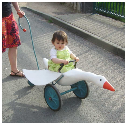
le manège sans fil à la fête du vélo

Cette année, nous avons souhaité une fête du vélo familiale, aussi, nous accueillons le manège sans fil. Le manège sans fil est composé d'une quinzaine « d'animaux engins » sur lesquels les enfants peuvent « faire un tour » comme sur les manèges traditionnels. Mais il n'y a pas de moteur... il faut pédaler ! Ce sont les parents qui guident, poussent ou tirent, s'ils le veulent bien... Le manège sans fil s'adresse aux enfants de 8 mois à 11 ans.